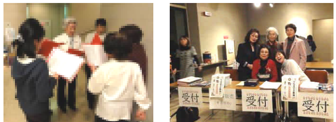
出演間際まで聖歌隊のパート練習